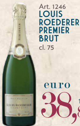
Art. 1246 LOUIS ROEDERER PREMIER BRUT cl. 75