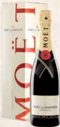
Art. 1212 MOËT & CHANDON BRUT IMPRIAL Astucciato cl. 75