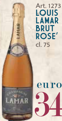
Art. 1273 LOUIS LAMAR BRUT ROSE' cl. 75