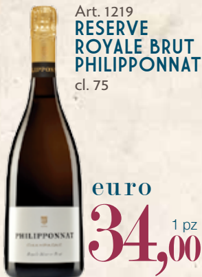
Art. 1219 RESERVE ROYALE BRUT PHILIPPONNAT cl. 75