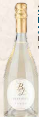
Art. 3170 SPUMANTE BEST BRUT Faleseo Lazio cl. 75