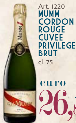
Art. 1220 MUMM CORDON ROUGE CUVÉE PRIVILEGE BRUT cl. 75