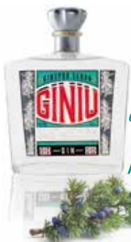
Art. 2861 GINIU Silvio Carta Sardegna - cl. 70

Ginepro Sardo con diverse varietà di erbe spontanee della macchia mediterranea