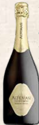
Art. 3733 ALTEMASI RISERVA GRAAL Cavit DOC Trento cl. 75