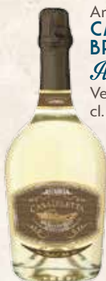
Art. 3659 CASA DILETTA BRUT Astoria Veneto cl. 75