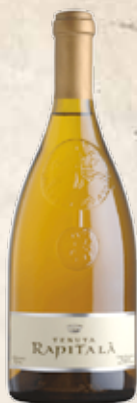
Art. 689 CHARDONNAY GRAND CRU Tenuta Rapitalà 2015 IGT Sicilia cl. 75