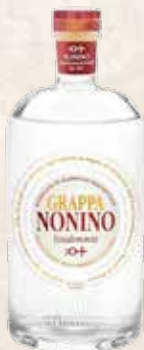
Art. 3766 GRAPPA NONINO VENDEMMIA BIANCA cl. 70