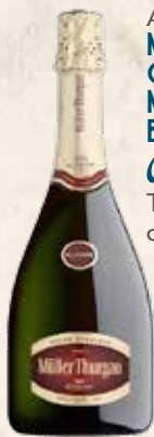
Art. 3735 MULLER THURGAU CUVÉE SPECIALE MILLESIMATO BRUT Cavit Trento cl. 75