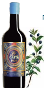
Art. 3851 MIRTO RICETTA STORICA Silvio Carta Sardegna cl. 70