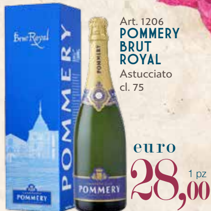
Art. 1206 POMMERY BRUT ROYAL Astucciato cl. 75