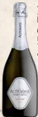
Art. 3732 ALTEMASI PAS DOZE' Cavit DOC Trento cl. 75

Una cantina davvero unica e avveniristica, fiore all'occhiello del territorio trentino.