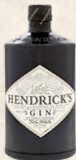
Art. 1507 GIN HENDRICK'S cl. 70