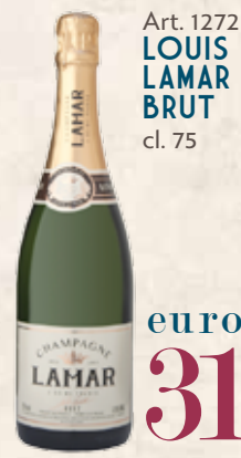
Art. 1272 LOUIS LAMAR BRUT cl. 75