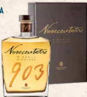
Art. 11280 GRAPPA 903 RISERVA D'AUTORE BONAVENTURA MASCHIO cl. 70