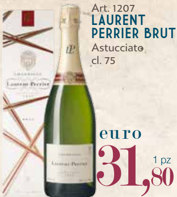
Art. 1207 LAURENT PERRIER BRUT Astucciato cl. 75