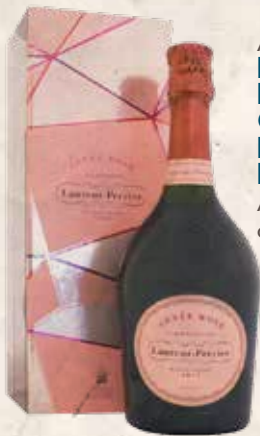
Art. 1256 LAURENT PERRIER CUVÉE ROSE' BRUT Astucciato cl. 75