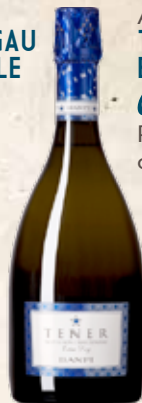
Art. 3614 TENER EXTRA DRY Castello Banfi Piemonte cl. 75